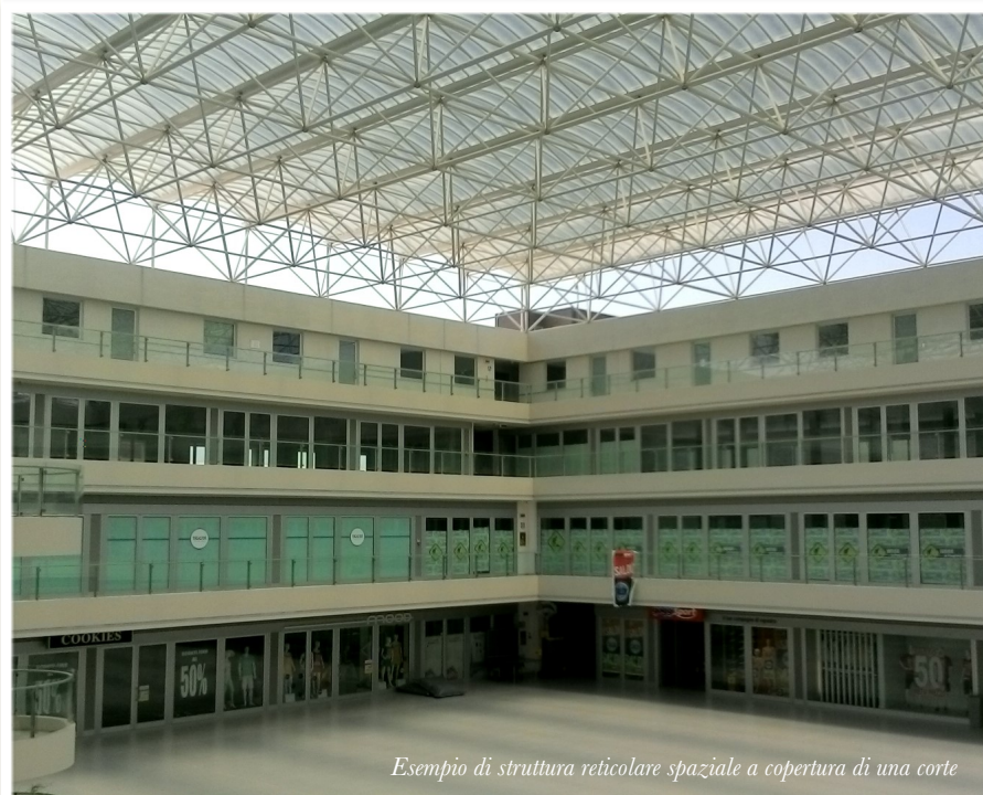
Esempio di struttura reticolare spaziale a copertura di una corte